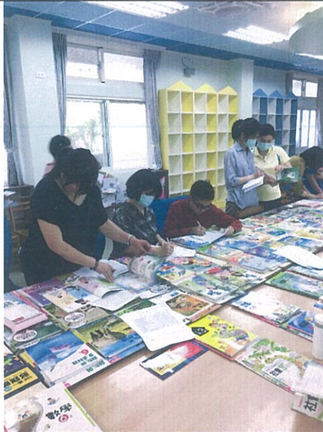
教師評選 105 學年課本照片