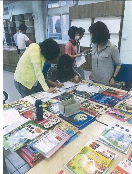
教師評選 105 學年課本照片