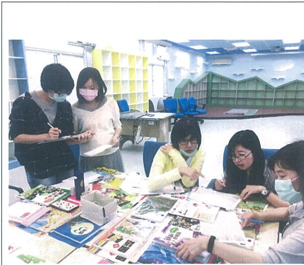
教師評選 105 學年課本照片