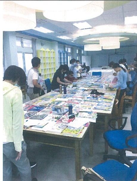
教師評選 105 學年課本照片